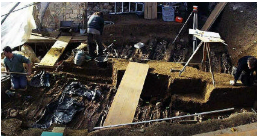
Ausgrabung in Zweisimmen: Archäologen und Anthropologen arbeiteten beim Freilegen und Dokumentieren des dicht belegten Friedhofs östlich des Beinhauses eng zusammen.