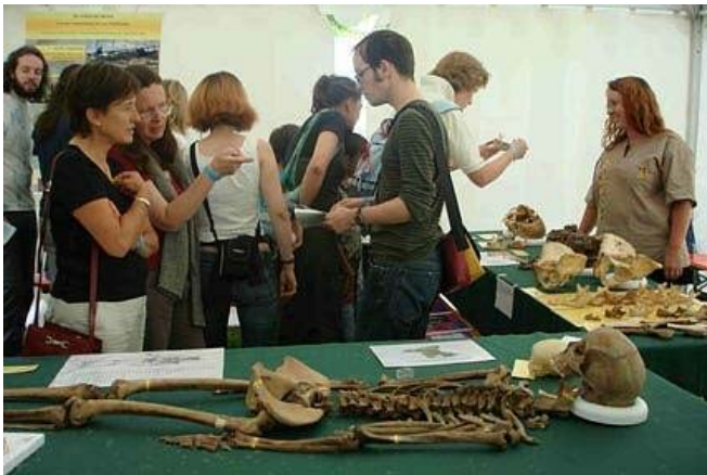
Oben: ArCHeofestival in Fribourg.