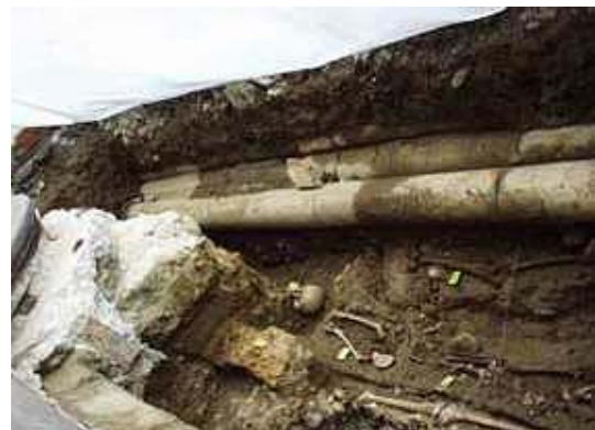
Rechts oben und unten: Bei der archäologischen Notgrabung im Friedhof der Heiliggeistkirche in Bern anlässlich der Neugestaltung des Bahnhofplatzes.