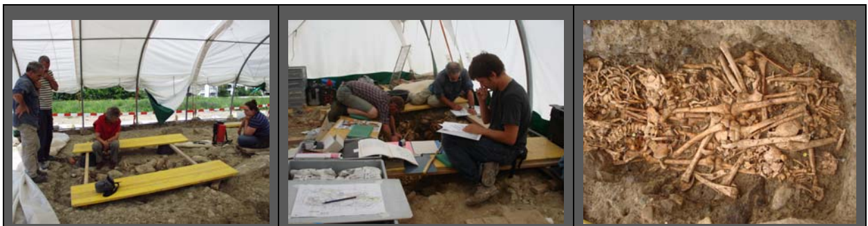
Die Ausgrabungen an der ehemaligen Berner Richtstätte „untenaus“ (Bern-Schönberg) waren für Archäologen und Anthropologen eine grosse Herausforderung (Fotos HA).