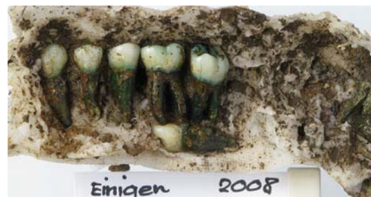
Bronzezeitliches Frauengrab von Spiez-Einigen (links) und Bergung mittels Cyclododekan.