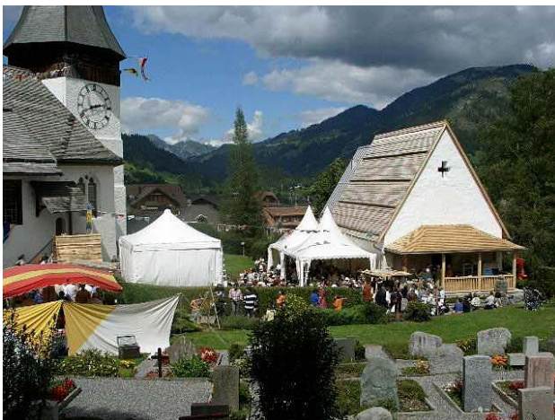
Mittelaltertage in Zweisimmen: Das renovierte Beinhaus wird eingeweiht. Im Erdgeschoss, wo einst die Gebeine aufbewahrt wurden, fand im August die Ausstellung der Historischen Anthropologie statt.