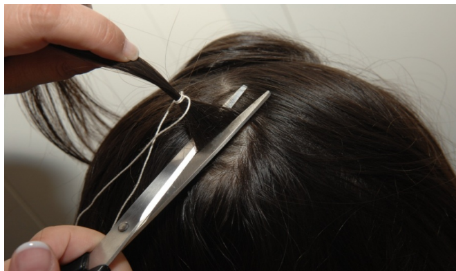
Bündeln, zusammenbinden, Abschneiden am Hinterkopf