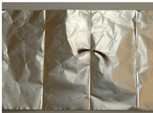
In Folie legen